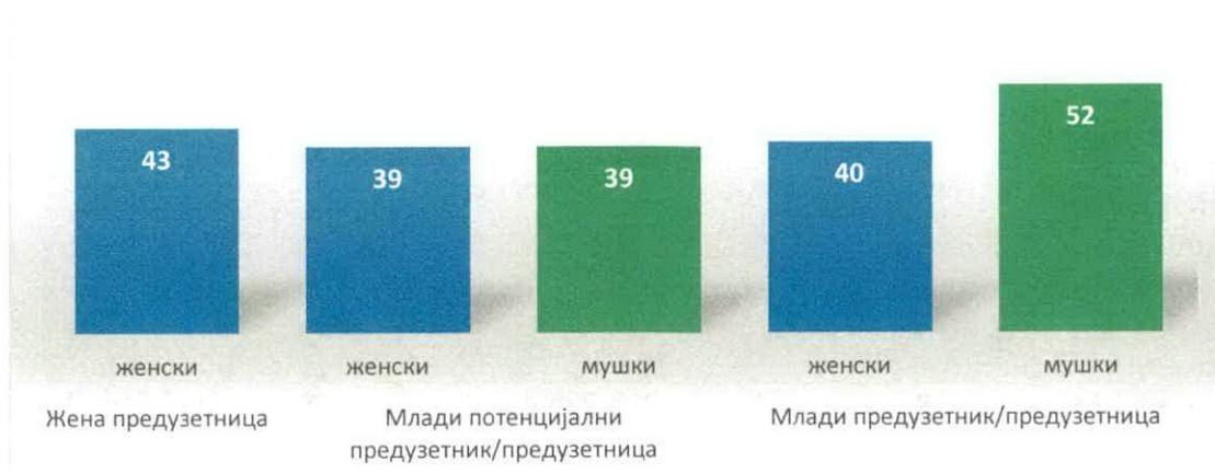
Графикон 2 : Графички приказ корисника пакета услуга по категоријама где је приказано колики је број жена корисница пакета

За 213 корисника пакета услуга за које су достављени исправни финални извештаји успешно је реализовано 807 сати саветодавних услуга, 7.502 сата менторинга, у оквиру реализованих обука 193 корисника је присуствовало обукама и 37 корисника је регистровало привредни субјекат у АПР. Укупан бруто износ за исплату АРРА износи 20.179.422,10 рел.