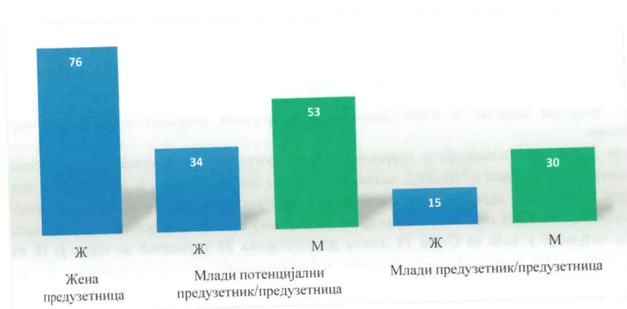
Графикон 2 : Графички приказ корисника пакета услуга по категоријама где је приказано колики је број жена корисница пакета.